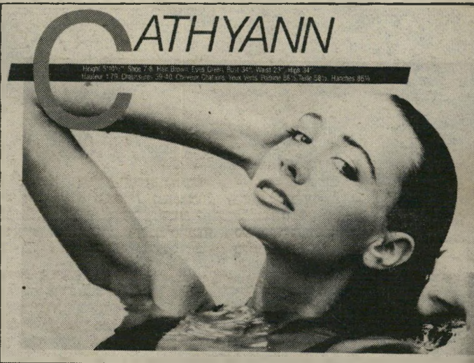
Height: 5'10 1/2" Shoe: 7 1/2 Hair: Brown Eyes: Green Bust: 34" Waist: 23" Hips: 34" Measure: 17 1/2 Chest: 32 1/2 Arm: 21 1/2 Leg: 28 1/2 Neck: 16 1/2 Hand: 8 1/2

גובה 1.79 אי-אפשר להתעלם מגובהה. בכל מקום שאליו היא מגיעה היא בולטת ביופיה, בלבושה ובגובהה. הורי מאוד גבוהים, אז מה הפלא שיצאתי כזאת? אומרת קטיאן.