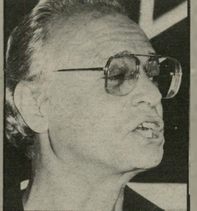
סופר קישון דבר מה רקוב

למיקרא כמה מהדברים שכתב קישון, באותה תקופה, אין לי ספק, שהוא מתעלה בערכו, על-