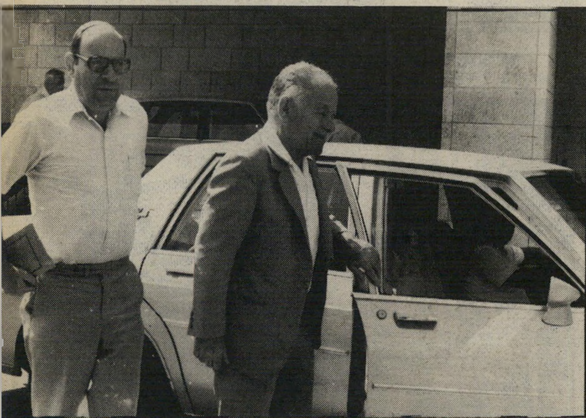
שר החוץ יצחק שמיר וסגנו יהודה בן מאיר

מזה חודשים אין קשר בין הרמטכ"ל היוצא וראש הממשלה. אך בשבועות אחרונים התחילו אנשים שונים ליצור את הקרקע לקשר ראשוני, בלתי מחייב, בין השניים. רפול אומנם הודיע חרי"שמעית שהוא חושב על הקמת גוש לאומני חוץ-פרלמנטרי, אך מקורביו אינם רואים בכך סוף פסוק.