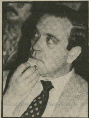
פת לא בעדינות

כל הניתוח הזה נעשה על סמך ההנחה (הבלתי-סבירה, יש לקוות) שכוחות המישלוח יגיעו לחזית ללא הפרעה. אולם, נוסף לכך, יש לקחת בחשבון את הגורמים הבאים: