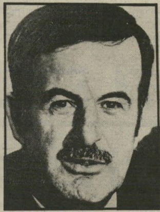
אסד נשק מזרחי

מתוך כמות מטוסים זו חלק נמצא באחסנה, בין אם בשל מחסור בצוותים ובין עם עקב מחסור בחלפים. במצריים נמצאים, על-פי מקורות זרים 300 מטוסים באחסנה, בעיקר עקב מחסור