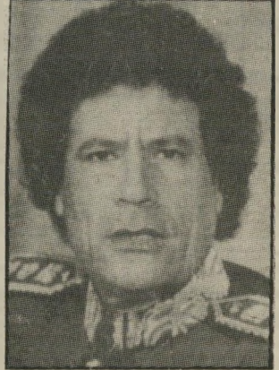
קדאפי לא מאויש

בחלפים. אם נניח שהלוהבים מצליחים לאייש 50% ממטוסיהם, פירושו הרבר שכ-150 נמצאים באחסנה. גם בסוריה נמצאים 5%-10% מן המטוסים באחסנה. פירוש הרבר שמול חילה-האוויר הישראלי, שכל מטוסי פעילים, עומד