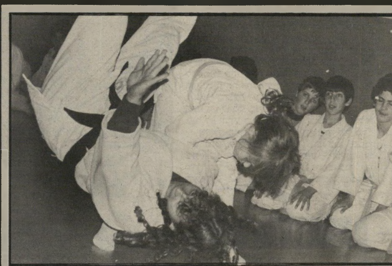
ג'ודוקאית מגן חיים קשים