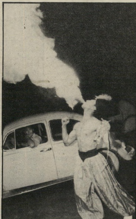
אש בכה רפי שאולי הזמין ליצנים ובולעי אש, שעצרו את כל התנועה. המכוניות צפרו וחלק מהאנשים שישבו במיסעדות הסמוכות קמו בבהלה כשראו אשן עשן.