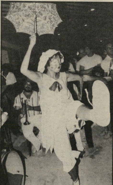
שימשייה בלילה גשם מלאכותי כי גשם מלאכותי לא היה, והירח והכוכבים לא הצריכו שימשיות, אבל ליצני-הרחוב השתמשו בה בהופעה שלהם.

שאולי ועובדיו לא הסתפקו בליצנים. הם החליטו להאכיל את כל העוברים-ושבים ברגים תוצרת ישראל. הם העמידו רוכן ענקי, שעליו פוזרו עלי חסה ופטרוזיליה, ומעליהם הונחו