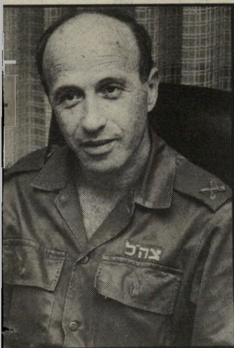
קורא שליו שם חדש

המרכז למחקרים אסטרטגיים משנה את שמו. בעיקבות תרומה נכבדה שבה התחייב תורם מארצות-הברית בשם