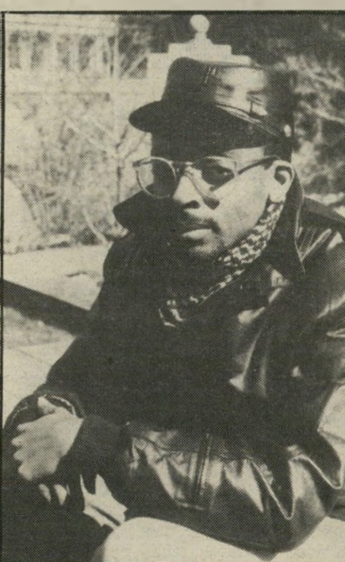
חצי ברדלס הבימאי הצעיר ספייק לי התחלק במסע השלישי עם סרט בראזיל. לי זכה בזכות שפה אישית בשילוב חוש הומור, שהגיעו להרמוניה עם הסיפור והמישחק.

האם, הפוחדת לעשות משהו על דעת עצמה, כי חוץ מעבודת שירותים אין לה מה לומר בבית זה, פונה לעזרת. האב, שמתחמק כל העת מעימותים עם בנו, מאושר כשהמורה הולך תחתיו לבית-הספר לסדר את ענייני בנו, ואפילו מרוצה