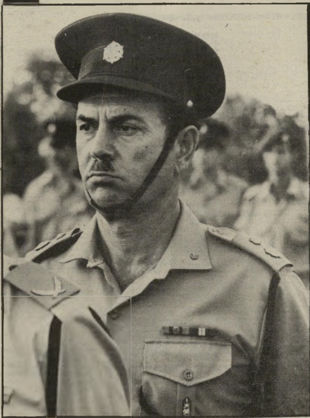
תתי-ניצב זיגל לא מתמודדים עם הבעיה

מן המחקר עולה, שקיימים שני מרכיבים גדולים לסחר במט"ח, ושניהם באזורי חרדים. האחד הוא בני-ברק, והגרול יותר מצוי במאהר-שערים. בראש שני הכנסים הפרטיים הגדולים