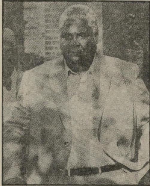
אנוקומו בלונדון בדרכו הביתה מיבחו חשוב למוגאבה

השבוע קיים הקונסורטיום, שכלל נציגים מ־246 מדינות, ישיבה בניו־יורק, שהוקדשה לאישור סופי של האשראי הגדול לארגנטינה. נציגי בריטניה הודיעו שחלקם בהלוואה יהיה כרבע מיליארד דולר. כך הגיע לסימום החלק האחרון של הפארסה הקרוייה מאלווינס־פוקלנד, שהיתה עשויה להחשב למצחיקה, אילמלא מחיר הרמים ששילמו ארגנטינים וכרטיסים חפים מפשע.