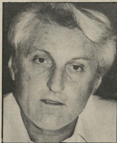
מועמד צ'יץ': אפארטהייד?

או שמא היתה הצבעתי מתפרשת כהבעת אמון לראש-הממשלה, לממשל