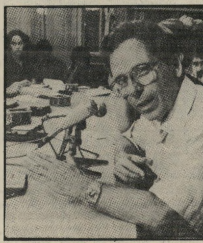
מנכ"ל סדן אכזבה לטובה

מי מייצג את משל-המיסים בממשלה? שר-האוצר, יורם ארידור; עובדה, הוא מעלה את שיעורי המיסים הקיימים ומציע מיסים חדשים. במיוחד לבעלי-היכולת. הוא יוצר מה שהכלכל-נים נוהגים לכנות, "חלוקה מחדש של ההכנסות למי שיש מעט, יהיה מעט פחות ולמי שיש הרבה, גם לו יהיה מעט פחות. עד לאחרונה היתה החלוקה מעט שונה: המדינה היתה עניה, האורחים בעלי-יכולת, את הגירעון או הפער שבין עושרם של אזרחי המדינה ועוניה של