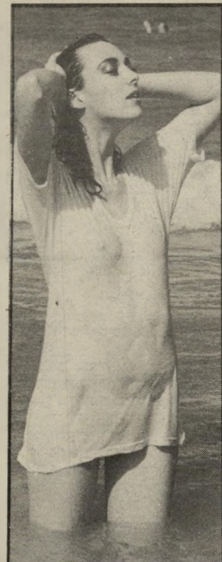
עדייה בים משקה זה נקטר

שאלתי אותו מה קרה להאבה הגדולה שלו אלי. והוא ענה כי לזה שהוא אוהב אותי אין כל קשר. הוא אמר שלאדם אין זכות להיות רכושני לגבי השני. כי מין זו שפת תיקשורת, וכמו שאני לא יכולה לאסור עליו לדבר עם מישהו. אין לי זכות לאסור עליו לקיים יחסים עם מי שהוא רוצה. היה לי קשה לקבל את התיאוריה החדשה. באותה התקופה הייתי