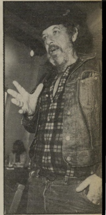
בן-אמון בגינס קניית בגדים זה ביוזום

לוי עזר תיאוריות משונות אחרות. למשל, היה אומר כי לא צריך לחמם מים כדי להתרחץ, וכשהייתי מרליקה את הרוד היה דן ממחר לכבות את החשמל. הוא הסביר לי כי לא צריך להתרחץ יותר מפעם