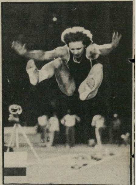
אצנית רומניה קושמיר לא הגיעה

אין ספק שהספורטאית הבולטת ביותר באי ליפות העולם כאתלטיקה קלה, שהתקיימה השבוע בהלסינקי, היתה האצנית הצ'כית ירמילה