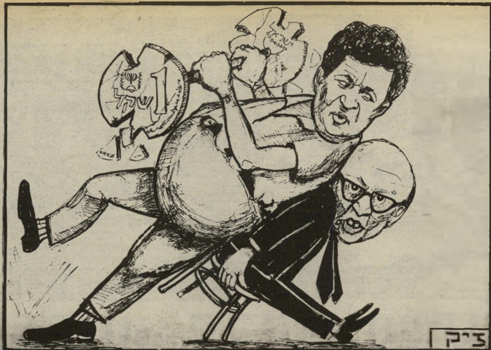
יש לי גיבוי של ראשהממשלה!

השבוע התקבלו במדינה החלטות, האמורות להיות בעלות חשיבות רבה לדרכה הביטחונית של ישראל בשנים הבאות. הנושא היה, כביכול, כספי: הקיצור