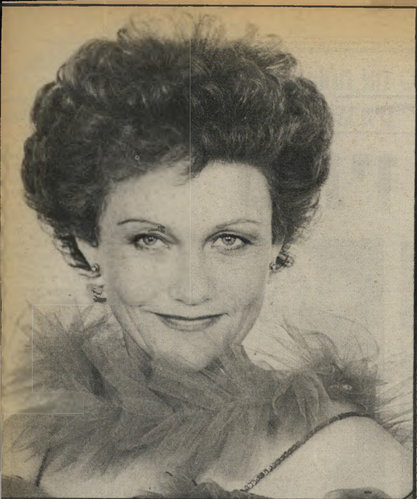
שופיך שני בסך הכל שרירים