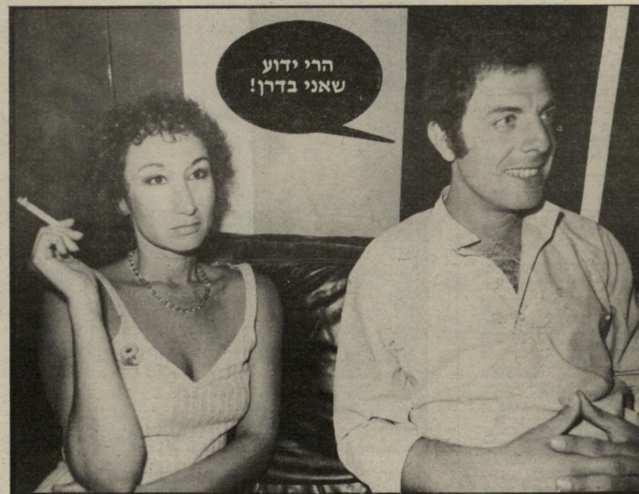
הבדרן ספי ריבלין וידידה