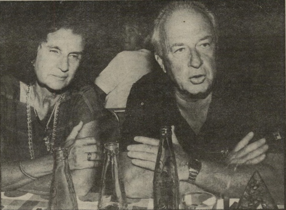
יצחק רבין יושב עם אשתו, לאה, אחרי שעמד בתור כרבים אחרים. עד שנמצא עבורו במקום המיגוש הפופולארי ועבור אורחיו שולחו פנוי. הוא הזמין, כיתור שבטיילת התל-אביבית האבטיחים. רבין בא יושביה השולחו, פלח אבטיח, קינח בבקבוק במקום באחד מימי השבוע, בשעה 1 אחרי-חצות. משקה-קל. לאחר שסיימו לאכול עזבו את המקום.

ללות אזהריהם באיצטדיון בלומפילד ביפו כתחילת העונה, במישחק מול הפועל תל-אביב. בין שאר העונשים הוטל עליהם עונש מישחק רדיוס עם קהל. ראשי האגודה חשבו ומצאו, שהמקום הטוב ביותר לערוך בו את המישחקים הוא שוב איצטדיון בלומפילד. שבו הם