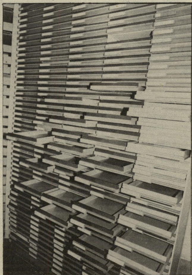
המדסים הריקים אחרי החיפוש - של לקוחות המישרד -

לארצות-הברית. כמוכן שלא היה בכלל מה לדבר על כזה דבר.