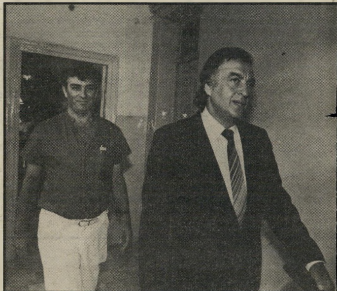
המורשע הקודם שמואל פלאטו-שרון (מימין) הגיע השניים נכנסו לבית-המישפט אך יצאו ממנו כעבור דקות ספורות. בסיום קריאת פסק-הדין עזבו את המקום במכונית המרצדס של פלאטו.

אחרי שיצא, נכנסו פלאטו-שרון ואלי רונן למכונית המרצדס הנוצצת של פלאטו והסתלקו מהמקום. זמן קצר אחריהם התפור גם קהל האוהדים כשקריאות נקמה נחלשות והולכות נשמעו לאורך כל הדרך.