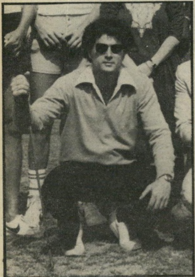
מנהל ברדוריד כמו גליקשטיין

בינתיים היחידים שהתעוררו הם שכניה של קיסריה, בניה של העיירה אור-עקיבא הסמוכה. כמה מבני המקום הצליחו בשנים האחרונות להגיע להישגים בולטים למדי, וזכו לנסוע לתחרויות כרחבי העולם. כדי למשוך עוד בני נוער לגולף, פתחו אנשי המועדון בית-ספר לנוער ללימוד הגולף. אך מסתבר שגם מיכצע זה אין די בו, טוען ברדוריד. "כולם אומרים עדיין שגולף