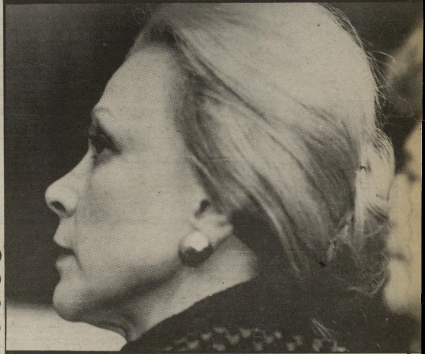
רחל דיין לבד

מאז שנפטר משה דיין, לפני שנתיים, לא חדלו ההשערות על העומד לקרות לרחל דיין. מה תעשה? מה יהיה מעמדה החברתי או הפוליטי? התינוא שוכן בקיצור, כולם רצו כותרות על הליידי מס' 1 במדינה. ואמנם, רחל היתה בכותרות, אך לתקופה קצרה מאוד, שעה שמילחמת-הירושה התחוללה מעל דפי העיתונות. רחל אכן נהגה כליידי גם בפרשה עגומה זאת, אך מאז היא הולכת ונעלמת