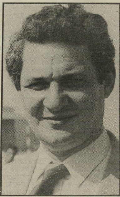
שר ארידור עובר ולא שב

יש עוד משהו חשוב שאיננו ברור, והוא חלק מערפליהקרב, מקצצים כמה? מה"מיסגרת", כלומר מההקצב המאושר, או שמעבירים מסעף לסעיף בין המישרדים. מקצצים מהתביעות הנוספות או מקצצים ב"בשר החי". ההנחה היא שזה יהיה צרף של השניים. מה שעוד ברור, שה"איש" להטיל מיסים נוספים היפוך לאפשרי מאוד, כולל המס החביב על שרהאוצר, המס על ע"ש (עובר ושכ) שכולו עובר לקופת האוצר ולא שב ממנו. כי מה שצריך לשוב, השרותים וגם הסוכסוכיות יקוצצו. אני עדיין זוכר, לפני המפלת בבורסה, כאשר הר"ד יקר פלסג, יועצו של שרהאוצר או, ועדיין היום, אמר שאנחנו צריכים לשאול מדוע בנו של בעל היכולת צריך להנות מחוק חינוך חובה ח"גם ולא לשלם עבור חינוך תיכון, אמרו שזה שיגעון להציג שאלה כזו. עכשיו היא תהיה נורמלית — התשובה. לא יהיה חינוך תיכון חינם. מי היה