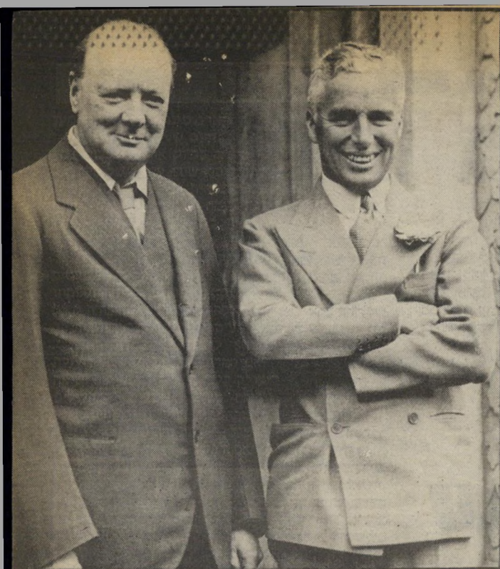
צ'ארלי צ'אפלין עם וינסטון צ'רצ'יל