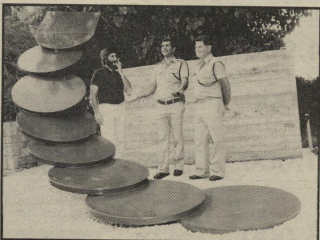
פסל ארנבורג וזרימה משוחח עם הסביבה

שניתן יהיה לראות אותו משלוש נקודות שונות כאשר עוברים בכביש. הפסל מורכב ממשולש, כאשר הארמה מהווה חומר מוליך, כשהוא יוצא ממקום אחד לשני ולשלישי, ממשיך את צורתו ומשנה את צבעו על-ידי השפעת האדמה. תפיסת הפסל היא כבר לא מקומית אלא סביבתית. מימד בלתי-שימושי. כל חלק מהפסל הוא בגובה של שלושה מטר, ופריסתו שישיה חצי מטר. גודל הפסל נקבע על-ידי הסביבה שבה אני מציב אותו. כל מיבנה שהוא בלתי-שימושי, כלומר שאינו ארכיטקטורה, חייב להיות בעל מימדים כאלה, שישוחח עם הסביבה הקרובה. ובאמת, אחת הבעיות הקשות המעסיקות אותי היא קביעת מימרי הפסל. פסל הוא השלמה לסביבה, והוא יוצר עימותים עם בניינים או עצמים קיימים. הוא יכול להוסיף לסביבה מימד בלתי-שימושי אך בעל משמעות. פסל יוצר ציון דרך בעיר."