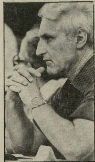
רודף-כלבים להג' להתאפק!

המונח הרומאי סכיופריה הוא מאוד לא מוצלח. הוא בא לציין מחלה אשר עיקרה הוא סכיזם (שסע) בין השכל והרגש, כיום כבר ברור שאין זו