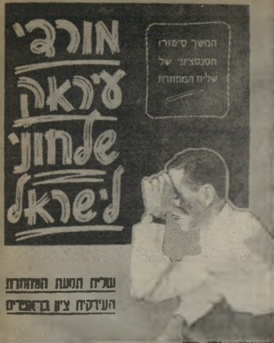
העולם הזה 1089. תאריך 13.8.1958

לחוג לה חג עשור קוסמופוליטי. לחוג לה מהו - לחוג לה מהו. לחוג לה חג עשור קוסמופוליטי.