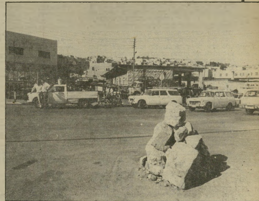
מוות מול מוות למעלה: גל-האבנים שהוקם בכיכר שליד השוק בחברון. במקום שבו נרצח תלמיד-הישיבה אהרון גרוס. משמאל: שלולית הדם במקום שבו נרצח אבויזערור, מוקפת אבנים למחרת הירצחו.

יום ג', שעה 6 בבוקר, שכם. אילהאם אבויזערור פקחה ווג עיניים חומות גדולות. היא התמתחה בעצליים והביטה החוצה. השמש כבר היתה גדולה וצהובה בשמיים כחולים נקיים. היום יהיה יום חם, חשבה לעצמה וקמה להתרחץ. מצב-רוחה היה מרומם. נותרו חמישה ימים בלבד עד לחתונה שלה, והיא חיכתה לטקס בכיליון-עיניים. אילהאם התלבשה. היא ידעה שגם היום לא תלך לאוניברסיטה — מיכללת אלינג'אח בשכם — מכיוון שזו סגורה כבר מזה שלושה חודשים.