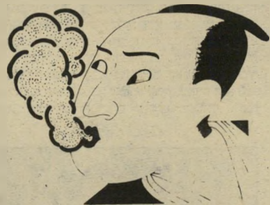
שום בלי ריח המצאה יפאנית

כל אלה שיכולים להרשות לעצמם לשחק טניס בלילה לאור ירח, ויכלו גם לרכוש מעטה כדורי טניס וזהרים, המוצרים על-ידי חברה המתמחה בכספם של עשירים.