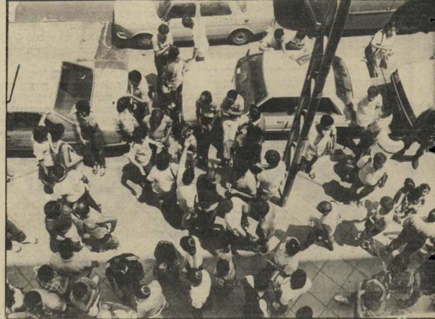
הבורסה האנושית כל המי ומי של הכדורסל בארץ מתקבץ בבית-הקפה פעם בשנה. כדי לחגוג את תום עסקאות ההעברה של השחקנים. כל אנשי הכדורסל מגיעים למיפגש, גם אם סיימו את עסקאותיהם.