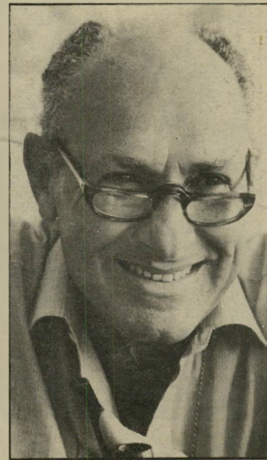
נשיא התעשיינים לגדואל מי יודע —

נוספים של החתונה — מעין הדרן — נערכו גם ביפאן ובבירות אירופה. בקיצור: חתונה כמו שצריך. כשהשיא ניסים רחמינוב את בתו, הוא הפתיע