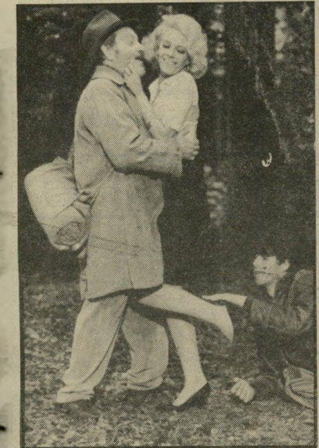
דלמיין סרויג ב.שביל החלב" מתיחה על ערש-דווי

למען האמת, הוא אף פעם לא היה מושבנע במלוא מובן המילה כי הוא אכן שחקן, לכל אורך הקריירה שלו הלך בעיקבות העצה שקיבל בימיו הראשונים, בעיר הסרטים, של הכימאי הוותיק אדמונד גולרינג: "היה עצמך". הוא התמיד בעניין, עלה בהדרגה למעמד של כוכב. הכל ידעו שניבן הוא אבי-טיפוס הג'נטלמן הבריטי המנומס והחביב, בעל עיקבות של דם כחול בעורקיו, בעל חוש-ההומור בריא אבל לא מזיק, זה שיכול להיות תמיד החבר הטוב של הגיבור או הגיבורה, האיש המפוקח עם העיניים הפתוחות לרווחה, בעל חיוך קטן מתחת לשפמו המטופה, שלא נסחף אף פעם בתאוות גדולות או בסערות-נפש - כי זה לא נאה לג'נטלמן אמיתי. גם כאשר אמרו לו שהוא שחקן מוכשר,