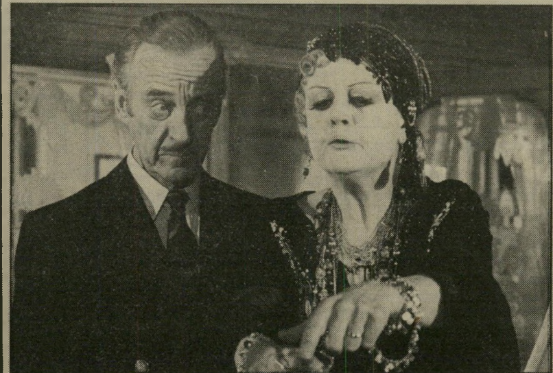
דייוויד ניבן עם אנג'לה לאנדסברי ב.מוזת על הגילום" שהיה בטעות שחקן

"שעה שאני כותב שורות אלה, שוב מרברים על המשבר הפוקד את תעשיית הקולנוע. יש אומרים שהפעם לא תתאושש יותר... אבל תעשיית הקולנוע כבר הוכיחה לא פעם בעבר את כוח עמידתה מול איתני-הטבע. ובימים אלה, של סופר-תיקשורת, איני מאמין שהאמצעי המוצלח ביותר לכידור המוני עומד פשוט להיעלם."