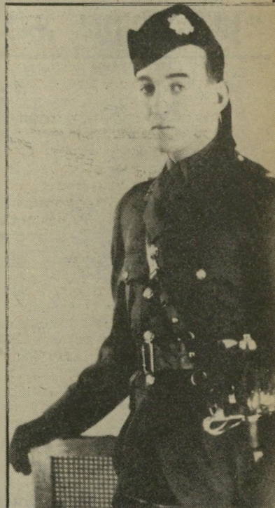
בו 18 מגויים ליחידת צבא סקוטיה גנטלמן אמיתי -

שמויים גרושי הכוכבים של הוליווד מסודרים מאור. לכל כוכב פינה משלו, ורק מעטים הם המעויים לוו ממקומם. דייוויד ניבן, שנפטר כשבוע שעבר, לא ניסה לעשות זאת מעולם.