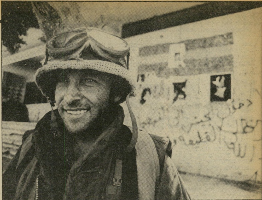
איש שריון בנבטיה: מה התקלקל בדרך אל הכביש?

הכוח המיוזחי והכוח המאוחר היו צריכים לפתוח בהתקדמות, למוטט את אגפי הריבזיה מס' 1, כאשר אז מצטרף כוח-המילואים וגולל את המערך הסורי במרכז הבקאע בתנועה מדרום לצפון, כאשר ההנחה היא שהפעולות באגפים יביאו להתמוטטות מערך-ההגנה במרכז הבקאע. אולם תוכנית זו היתה אופטימית