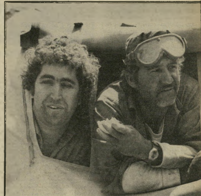
חיילים בחצביה בשבוע השני של המילחמה: הזמן אזל

למעשה נעו כוחות צה"ל וכוחות צבא-סוריה, אלה מול אלה, לכיוון כביש ביירות-דמשק.