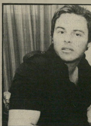
חוקר אמסל תדר נוסף

על כתפיו וזה אני, וכל האחרים רצו בניקיון כפיהם". בתשובה זו לא אובחנו מתחים המאפיינים רוכבי שקר. מכאן ששרון אכן מאמין שנגרם עוול לו ולמינה, ויש להתייחס ברצינות