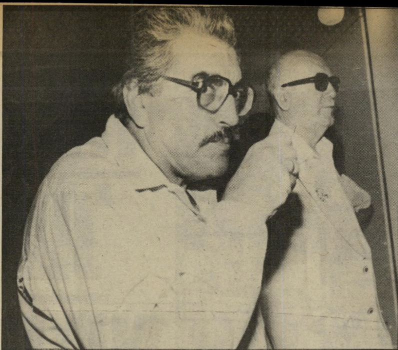
חברי מליאה הירושלמי חוק הוא חוק