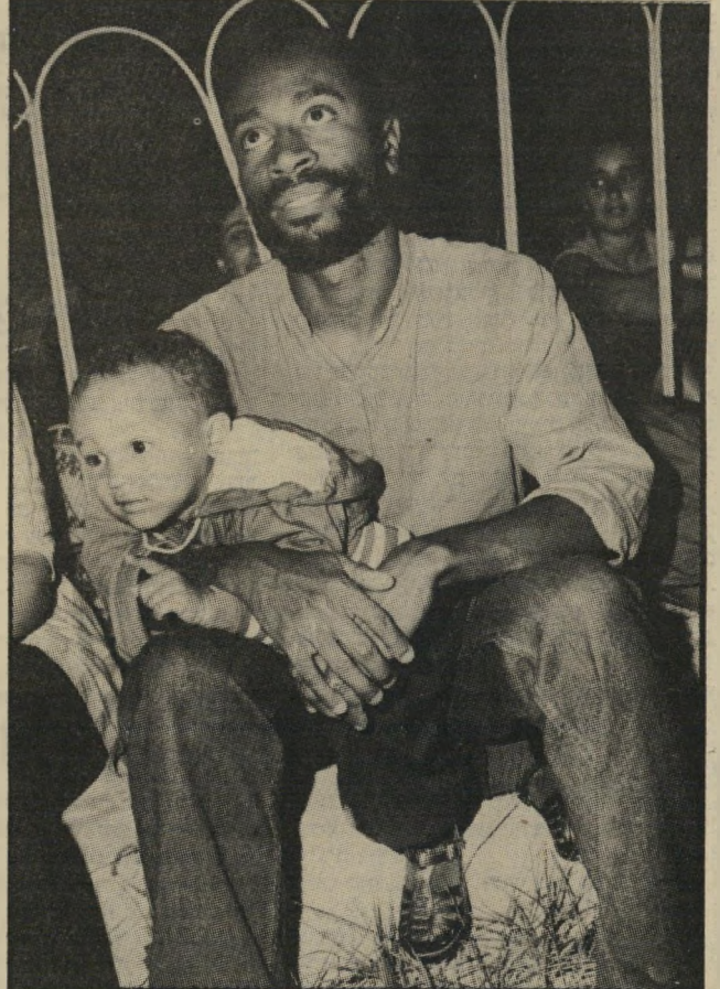
הקשבה לחברים הזמר הווירטואוזי בובי מקפרין בחברת בנו, בן ה-3. בכל פעם שהאב נמר לשיר, קפץ עליו בנו וחייב אותו. הילד גם ניסה כוחו בשירה.

באותו ערב באופן ספונטאני לבימה בשעה 1 אחרי-חצות נשמע לפתע קולו של צ'ארלי פישמן. «אריק', הכריו, תאוינו עכשיו ללארי קוריאל. מי שרוצה להצטרף לנגינה, יוכל לבוא לכאן ולתת קטע. הישראלים — אני מבקש ממכם לא להחזיק יותר מדי בכלים. רק קטעים קצרים — ומהר». לארי קוריאל ניגש לבימה והגיש קטעים של רוק. הצטרף אליו גיטריסט ישראלי בשם מיכה מיכאלי. קוריאל פרט על גיטרה חשמלית. ההופעה שלו הקפיצה את הקהל מהכיסאות, וחיימה את האוירה שהיתה ממילא כבר מחושמלת. אל איש הגיטרה הצטרף הסקסופור ניסט ברנפורד מארסליס. בעוד הם מנגנים רואט, הגיע אחיו של ברנפורד, החוצרן וינטון. השלישיה המוסיקאלית אילתרה במיומנות תלת-שיח מוסיקלי, כשכל אחד מהכלים קורץ כממזירות לעבר האחרים. אחר-כך הצטרף לשלישיה כוכב רביעי — הזמר בובי מקפרין, שבדרך-גנב את ההצגה. גם הישראלים רצו להרשים. המתופף אהרל'ה קמינסקי התיישב ליד התופים, הצטרפו אליו כמה מוסיקאים צעירים הנמצאים בראשית דרכם, וכל החבורה ניסתה את כוחה באילתורים. אך האמריקאים ישבו לצדי הבימה ולא הצליחו להסתיר את השיעמום, שהישרו עליהם הצלילים של הישראלים. אורחי פסטיבל הג'אז השלישי העניקו באותו ערב הרבה הזדמנויות למוסיקאים הישראליים, אבל הקהל המוסיקאלי נשאר מוקסם מהנגינה המיובאת. הכישרונות הצעירים של