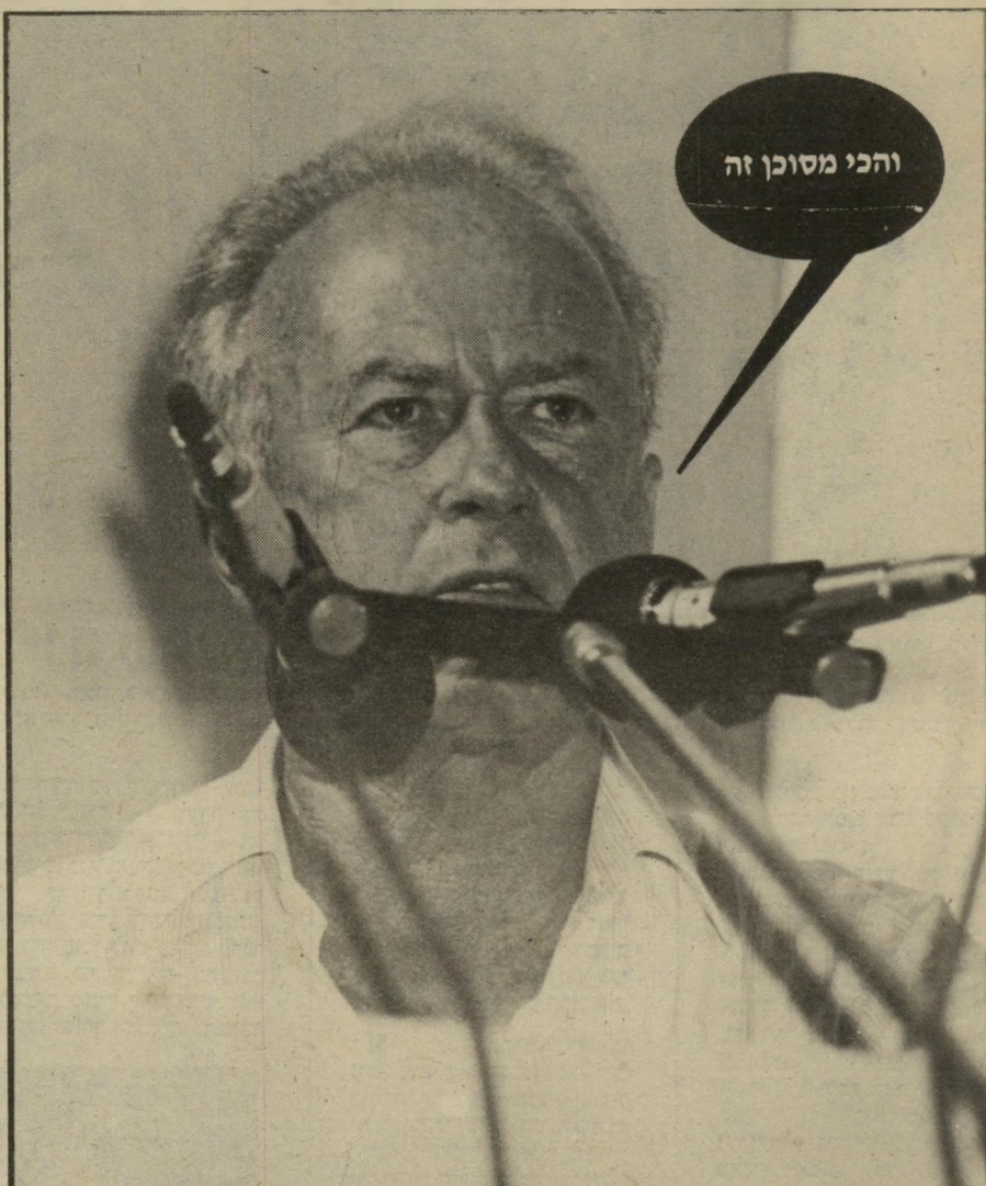
והכי מסוכן זה

● הסופר אברהם ב' יהושע , על "חזון השלום" שלו: "נחיה כמדינה יהודית לעצמנו, בלי שערכי יחצוצ' בינינו... אני