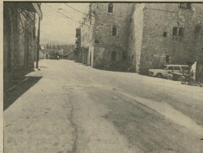
עוצר מייד אחרי הרצח הוטל עוצר מוחלט על העיר חברון כולה. איש לא הסתובב בחובות החנויות היו סגורות. מפעם לפעם נראתה מכונית של מתנחלים חסיני-עוצר חולפת במהירות בתוך העיר, שנראתה כעיר-רפאים. בכל פינת רחוב עמדו קבוצות-קבוצות של חיילים, ששמרו על העוצר. התושבים הערביים היו מסוגרים בבתיהם.