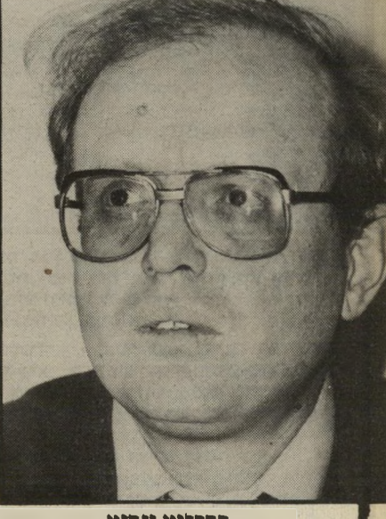
פרקליט גינזבורג ממש בדיחה