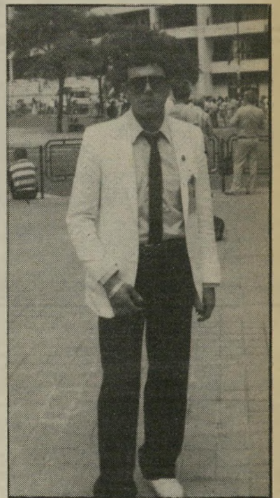
שדרספורט יצהר משולהבים

אנשי הטוטו עמלים קשות בימים אלה של פגרה בכדורגל, כדי למלא את קופתם המתרוקנת. ליגת הכדורגל האוסטרלי, שאותה הם מציעים עתה כאלטרנטיבה, אינה מעניינת