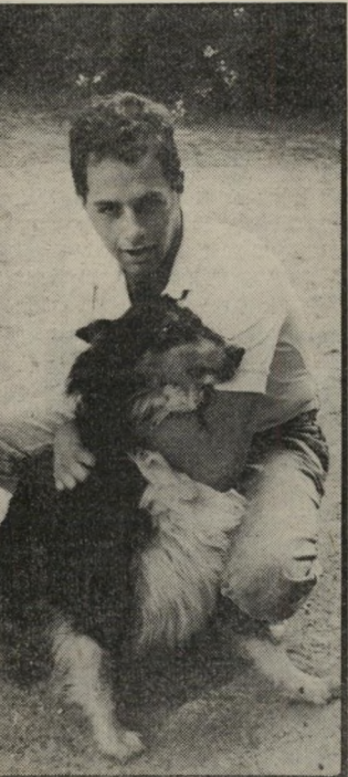
קנס זיוני אוסטר קיבל קנס עשתה את צרכיה בגן ציבורי.

בש. על ספסל אחר ישבו נשים קשיות, נהנו מהמשמש השוקעת. בצד אחר של הגן שיחקו ילדים עם אמנותיהם. במרכז הגן עמדו כמה בעלי כלבים, ששוחחו ביניהם. כלביהם התרוצצו על הדשא. הכלש חדר לתוך סכך-השיחים שמסביב לרחבה, התגנב לאט-לאט לכיוון החבורה. בעלי הכלבים שעמדו על הדשא לא הבחינו בכלל המתקרב, כשבידו מצלמת פולורואיד. בתנועה מאומנת הוא כיוון את המצלמה - ולחץ. הכלש הצליח. ערשת-המצלמה קלטת, ממרחק של 20 מטר משם, רלב שעשה לתמו את צרכיו.