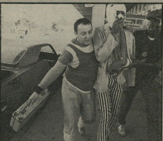
קולנוע: בדיחות אכזריות כדי לסחוט חיוך

העובדה שאינם יושבים במאריס (מדוע — זה לא כלי-כך ברור) כשכל נסיעה של קולנוע כרוכה בתקלה כלשהי. זה שיש בסרט הרבה הומור זעני, מילא. נראה שהכוונה היא להראות כי התייחסות מבודחת היא התייחסות האפשרית היחידה, בעיקר כשיש חוש הומור משני הצדדים (וזה נדיר).