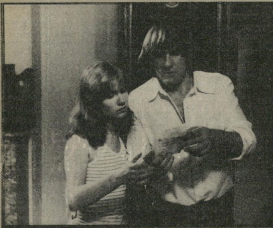
ז'ראר דפארדייה ואיזאבל הופר: הומור שחור

אבל במזגים הרבה יותר מודרניים, על רקע פאריס של ימינו, בצירוף אווירה דחושה, הומור שחור והתעלמות מוחלטת מן המוסכמות.