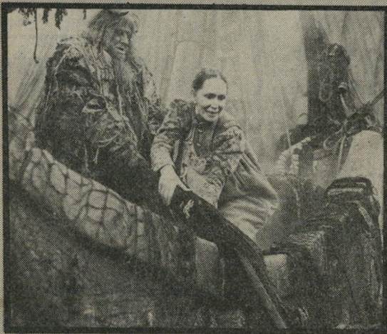
קתרין הלמונד ופיטר ווהן: יותר טוב בעבר

טרוני, היחיד שבו אין מתעללים הוא המלך אנגמנון (שון קורני), מפני שבין כה וכה הוא קורבן של אשתו המרשעת. זה בהחלט מברד, משעשע ומפעיל את הדמיון, ורק חבל שהמפץ החליט כי לצופה הישראלי לא מגיע לראות את הסרט בשלמותו. הוא ערך בו כל מיני שינויים, שימוצים וקטגוריים, שחבלט בהם הוא ביטול חלק גדול של האמיזודח של אנגמנון, אולי מפני שהיא פחות מצחיקה, במבט ראשון, מן האחרות.