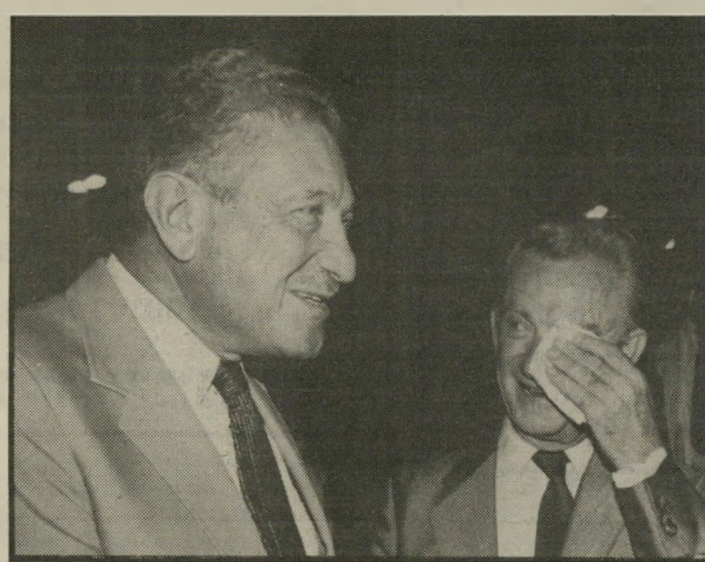
המספר לו דבר-מה. ביניהם עומד השגריר הישראלי במצריים משה ששון, המנגב את פניו מהחום הכבד ששרר במסיבה עקב הצפיפות ועשן הסטייקים.

חיזים למרות יריבויות מוליטיות המתינו המוזמנים האחד לשני ודשו בבעיות מוליטיות. מימין: שימעון פרס מחייד אל עזר וייצמו.