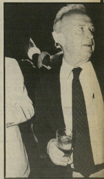
לחיים מרים כוס יצחק רבין. במסיבת השגרירות המצרית ב-31 מלאת 31 שנים למהפכה.

חיזים למרות יריבויות מוליטיות המתינו המוזמנים האחד לשני ודשו בבעיות מוליטיות. מימין: שימעון פרס מחייד אל עזר וייצמו.