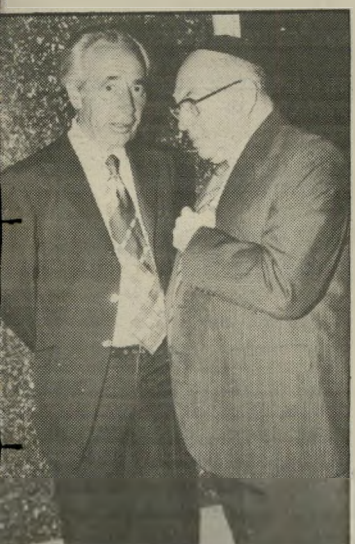
קואליציה שר-הפנים יו-האומוזיציה שימעון פרס פרשו לצד ושוחחו ביניהם, עד שהתגלו עלידי צלמי הווידאו שהנציחו את האירוע. הפ פנו למקום אחר.

ל א לעיתים קרובות אפשר לראות את ראש האופוזיציה שימעון פרס ואת שר-הדתות יוסף בורג, משוחחים ארוכות בפניה אפלה של האולם, עד שאחד הנוכחים העיר: הם הולכים להקים קואליציה! עזר וייצמן הסתודד עם שר-התירות אברהם שריר, והתחבק בחמימות עם השר יצחק מודעי, וגם זה אינו מחוזה הנראה ככל יום. הפעם נראו כולם מחייכים, שמחים ומרימים כוסות לחיים, רק שניים לא