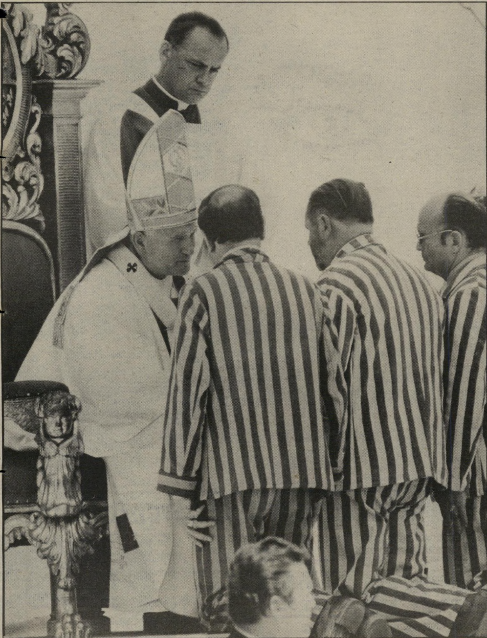
האפיפיור יוחנן פאולוס השני: נגישה בוורוצלאב

תמונה זו רגע אנושי בעל עוצמה: פגישתו של האפיפיור עם ניצולי מחנות ההשמדה שבאו להיפגש עמו בוורוצלאב, שם נערכה תפילה בנוכחות רכבות מפגינים, שנשאו כרוזת נגד נטילת זכויות האדם, כאז כן היום.