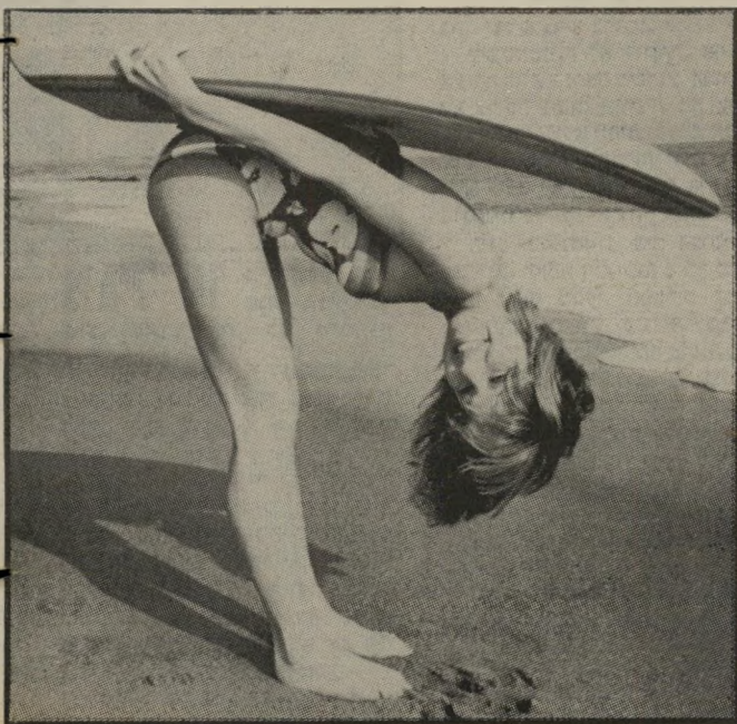
פיה זאדורה: חבר עדין ורך

הבימאי הבווארי הרברט (החור האחרון) אכטרנבוש הנראה בתמונה כישוע הנוצרי, התכבד להיות הראשון שהסיר את הלוח מעל פני מדיניותה של הממשלה הנוצרית-דמוקרטית, גם אם רק בענייני הקולנוע. סירטו רוח רפאים — גירסה אישית מאוד לחייו של ישוע הנוצרי — זכה, בצורת תסריט, בפרס העידוד של הממשלה הגרמנית. אבל, כשהשלים אותו וצריך היה לקבל את הרבע האחרון של הכסף, נתקל אכטרנבוש בשרהפנים הגרמני, פרדריך צימרמן, שהטיל וטו על מתן הכסף: "זהו חילול ערכי הדת וגסות רוח" קבע השור, וכל תעשיית הסרטים הגרמנית יצאה להגנת אמנות הקולנוע.