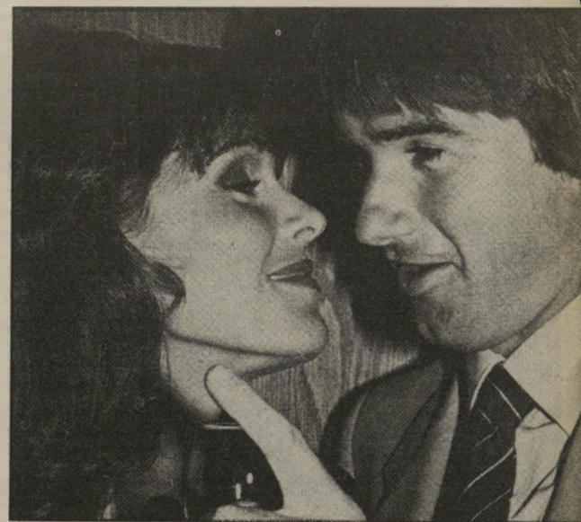
גי'מי קונורס: המאבק על הכדור

פיה זאדורה, חסידת המינגלס הנ"ל, הנראית בתמונה ליד גלי הים במאליבו, מתכוננת להופיע כסרט חדש ושמו הגברת הבודדה. סיפורו: מאבקה של אשה צעירה המבקשת שיקחו אותה ברצינות בהוליווד. מישהו יודע את מי זה מזכיר לו?