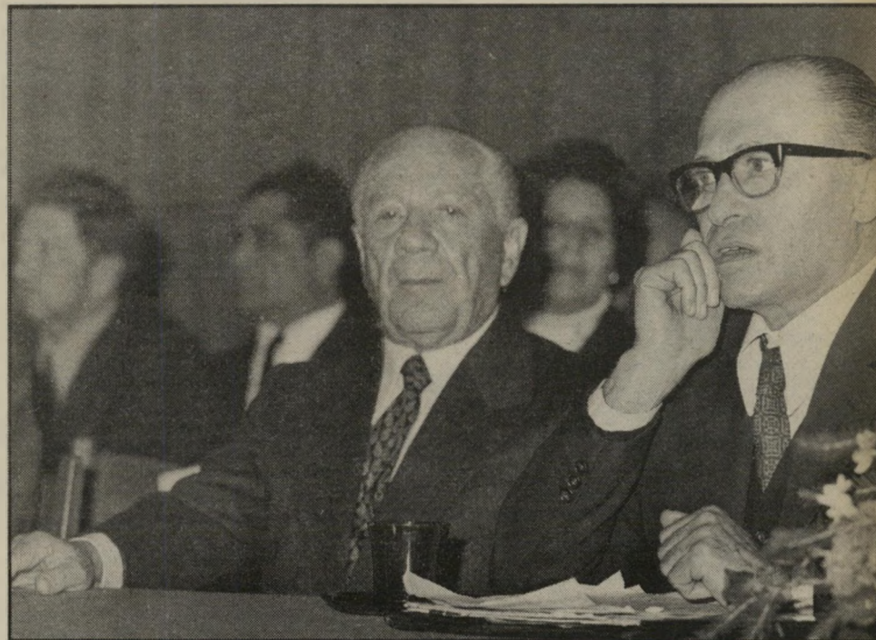
בעל-עיתון כרעמי עם בן-בן מדינה נפלאה ועם נפלא

עובר כרעמי מחזיק במחצית המניות של חברת מודיעין, שהיא חברת-האם של מעריב. בשנה החולפת הגיע לשיאו המתח שבין כרעמי ובין המערכת של הצהרון, שבראשו עדיין מתנוססת הכותרת המעידה שלרעת