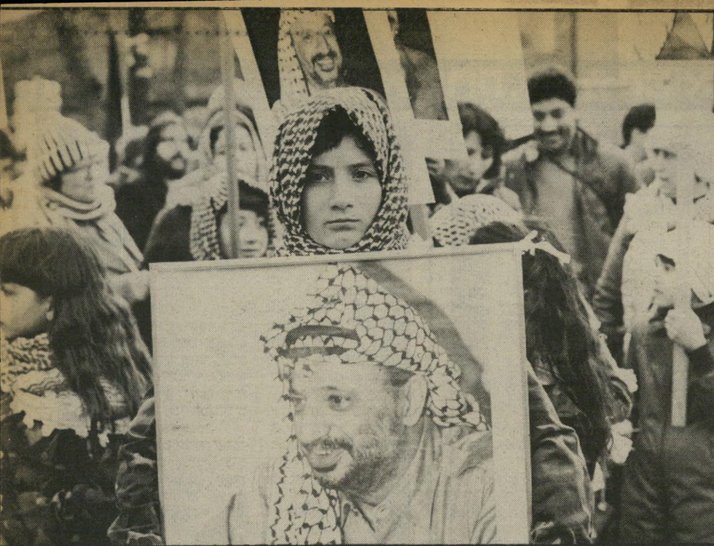
ילדים פלסטינים בגולה מפגינים למען ערפאת סוד הכוח

ערפאת החשיב מעל לכל את שלמותו ואחדותו של אש"ף, מכיוון שזהו הנכס היחיד שיש כיום לעם הפלסטיני, אשר אין לו כלים ממלכתיים אחרים. ישראלים, שדגלו בשעתו בחשיבותם המכרעת של המוסדות הלאומיים, ושהתקוממו