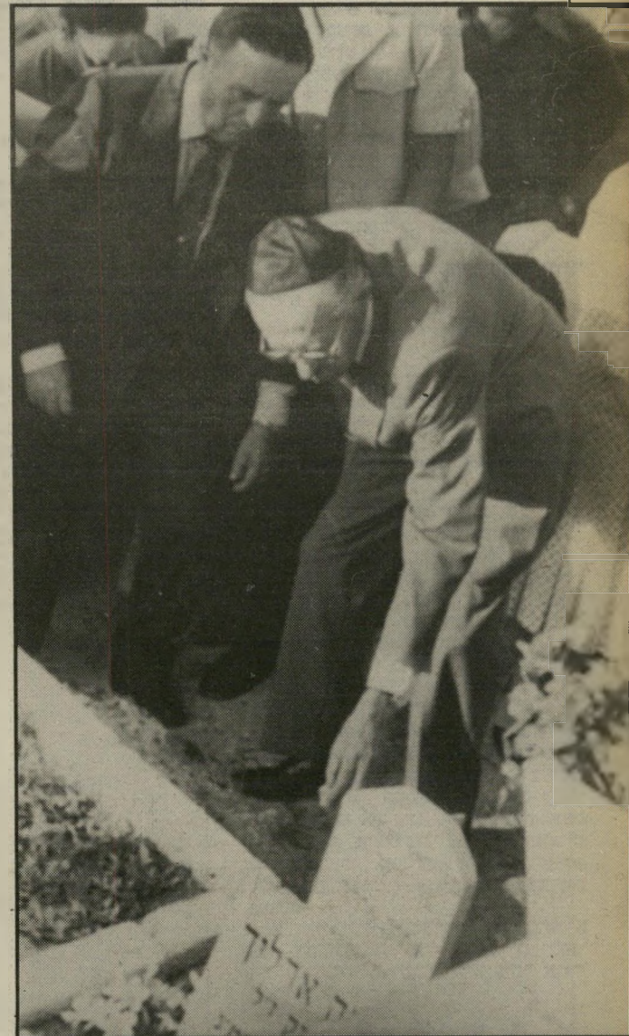
מנחם בגין מניח אבן על מצבתו של סגן ראשהממשלה 30 למותו. בלחץ המישפחה לא קיימה המפלגה הליברלית טקס אזכרה רב-משתתפים במוסיואון תל-אביב, כפי שראשי המפלגה התכוונו לעשות. מוקירו עלו לקיבור בבית-הקברות בנהלת-יצחק.