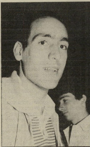
כדורסלן חוזו מסקרן

מפליא שיהודרה שיקמה , הרכו הארצי של הפועל, מצא לנכון לשהות בחוץ לארץ רווקא כימים קריטיים אלה. יוצא אפוא, שבימים מכריעים אלה לא ניתן לבצע שום עיסקה באגודת הפועל. השאלה ששואלים אנשים המקורבים לענף הכדורסל ולאגודת הפועל היא: