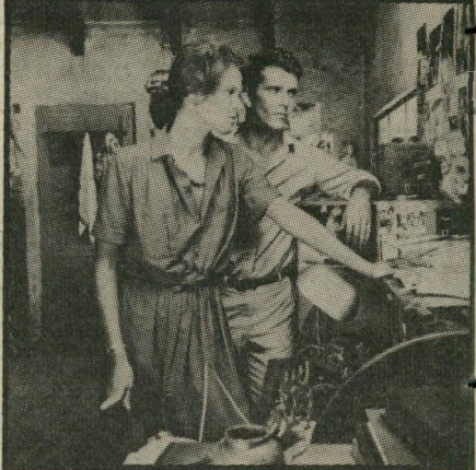
מל גיבסון וסיגורני ויורז המערב צופה מן הצד

● האם הסוף הרומנטי שבחרת לסרט בעל גוון פוליטי ריאליסטי כל-כך לא הפריע לך?