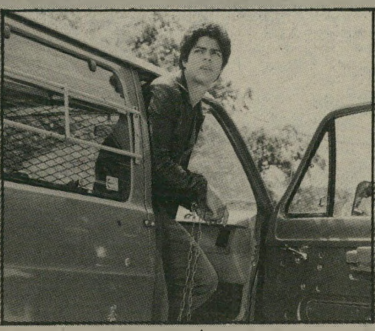
אזאי מוראלס: זרע הפורענות

כך למשל הגיבור, המרטש פרנסיס עורבים ושבים חפים-מפשע, כדי רוקן את כיסיהם, אבל הוא רגיש ואהוב עם נערתו, והוא גם אמיץ ונמרץ - ואם הוא מתנהג כפי שהוא מתנהג, זה רק משום שאמו היא מנפקת הסרת-תקנה, או יריבו הפורטוריקאי, שהוא בן טוב ואח מסור, הסוחר בסמים רק משום שהוא בן-מיעוט בשכונת-עוני. כל התירוצים האלה מתחילים כבר לעוף, אחרי שנשלמו