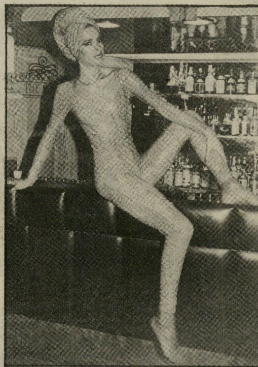
נחש לא ארסי ולא מסוכן הוא בגד-הגוף שעשוי כולו מאייטיס בוהקים. להשלמת המראה כורכים מיסת בד זהה על הראש. משמאל: מיכנסי ג'ינס אופנתיים.